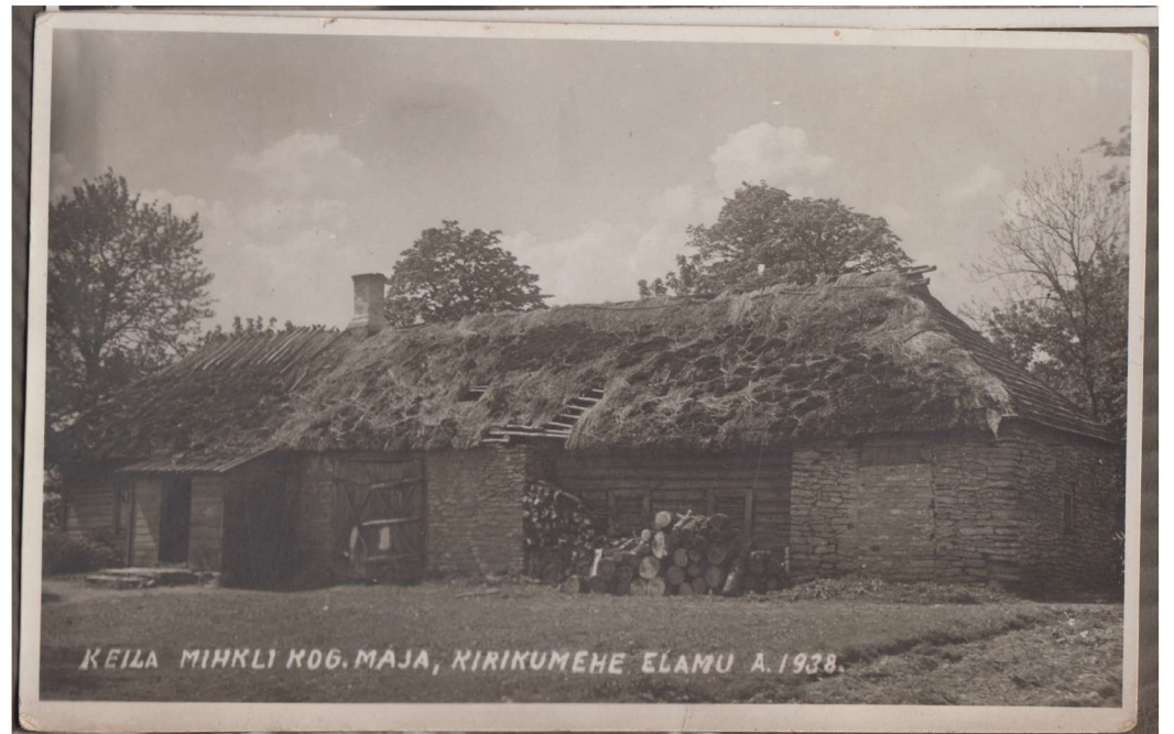
► Keila kirikumehes maja 1938. aastal