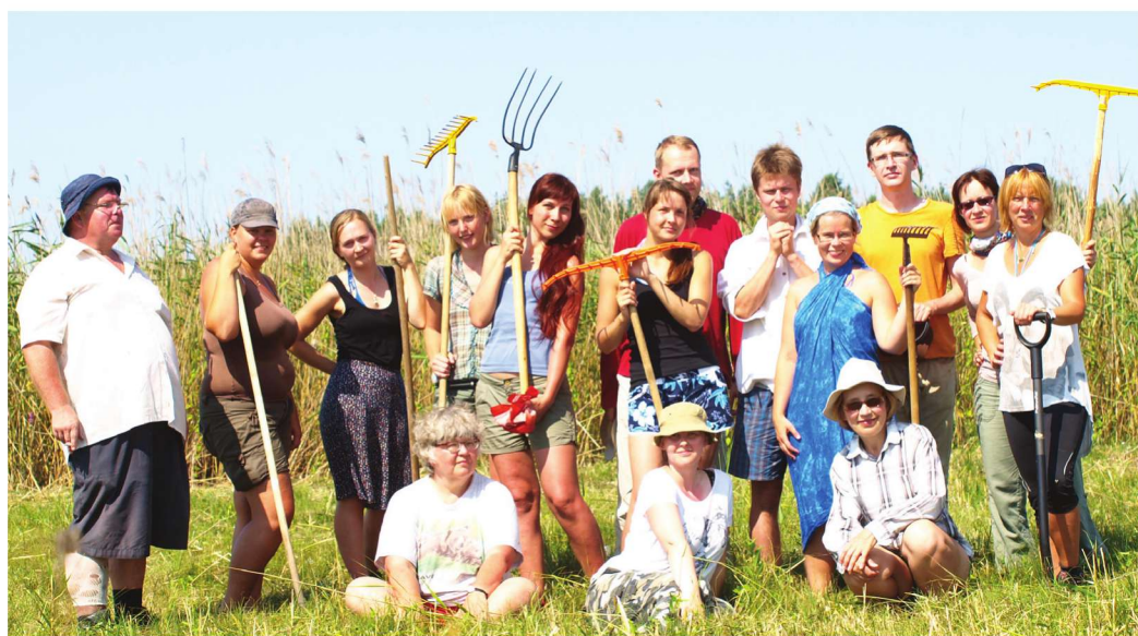
▼ Harilaiu poolsaarel kõreitiigi kaldalt roogu niitmas (juuli 2014).