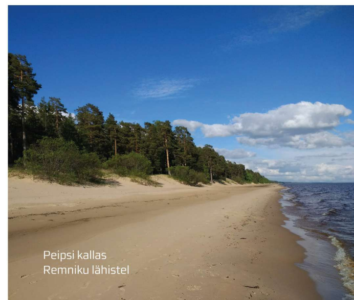
Peipsi kallas Remniku lähistel

Viimane päev oli taas päikeseline ning marsruut poole lühem kui eelnevatel päevadel. Alustasime rännakut kaunil määndidega palistatud rannaribal kõndides ning pärast Remniku küla läbimist – olgu siinkohal tervitatud kõik