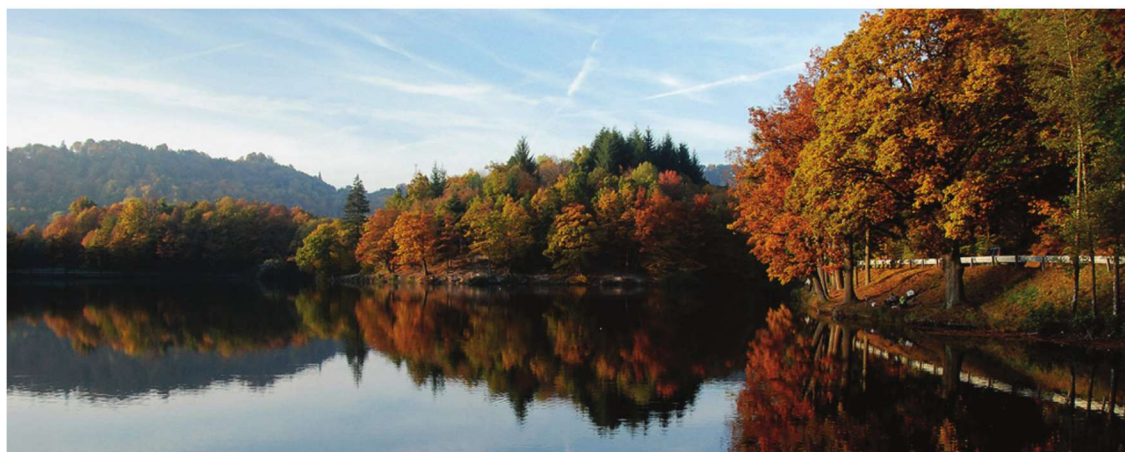
Počuvadlo ümbruses on imeilus loodus

Nädal algas grupivaimu tekitamise ja usalduse loomisega projektis osalejate vahel, mis tähendas nime õppimist ja seda lihtsustavaid mängu. Õppetunde oli päeva jooksul neli ning iga tund kestis 1,5 tundi. Esimesed päevad olid kergemad, et saaksime õppida üksteist tundma ning tutvuda teiste maade kultuuridega. Nimede õppimine läks alguses üsna raskelt, hiljem jäid need juba niisama meelde. Iga õppetunni alguses oli mäng ehk virgutus, mis pani tööle aju ja keha. Pärast mängu oli kas teooria või anti ülesandeid, mis vajasisid koostööd. Õppetunnid olid lõbusad, sest alati saime nii teema kui kaastlaste kohta teada midagi uut.